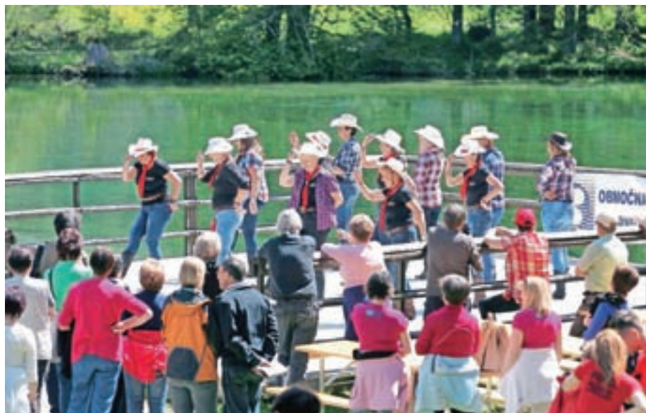
Organizator je poskrbel za raznolik spremljevalni program, v katerem je nastopila tudi skupina Colorado Country Line Dance.

ci so se lahko s konjem in furmanskim vozom popeljali po okolici. Prireditve je popestrila živa glasba z ansambлом Čudežni dečki.